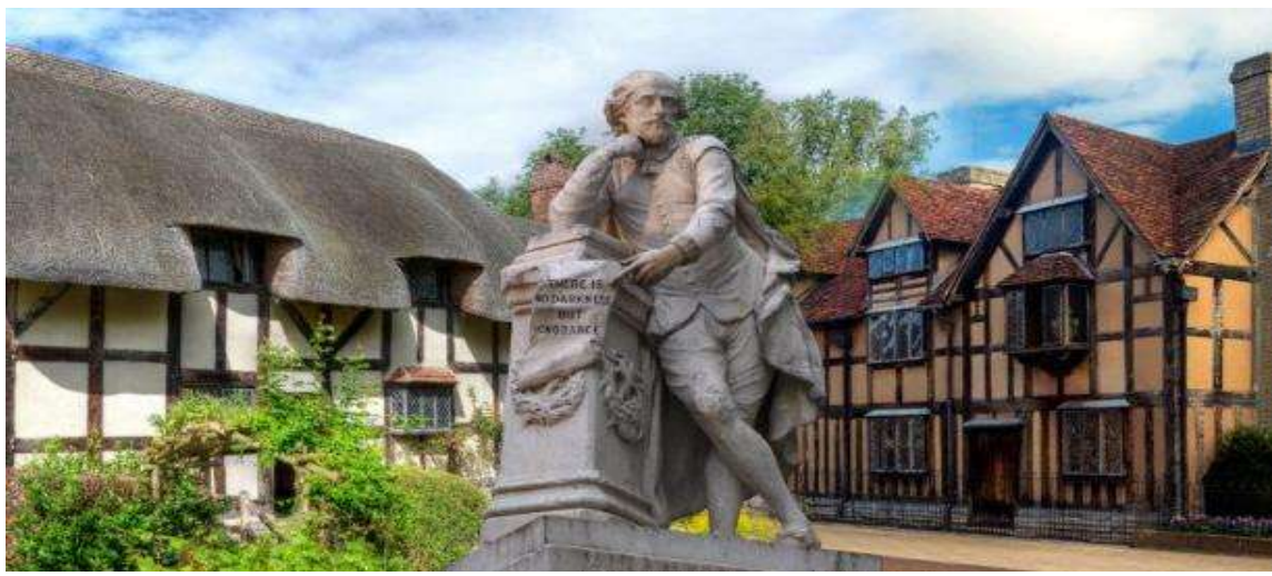
เปียร์ส” SHAKESPEAR’S BIRTH PLACE กวีและนักเขียนบทละครชาวอังกฤษที่ได้รับการยกย่องทั่วไปว่าเป็น

เดินทางสู่ “เมืองสแตร์สฟอร์ด อัฟฟอน เวนอน” (190 กม.) เมืองที่ยังคงรักษาสภาพแวดล้อมแบบชนบทของ อังกฤษแท้ ๆ ไว้ได้อย่างสมบูรณ์ เดินเล่นชมเมืองพร้อมถ่ายรูปบริเวณด้านนอกของบ้านเกิดของ “วิลเลียมเชกส