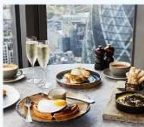
DUCK AND WAFFLE