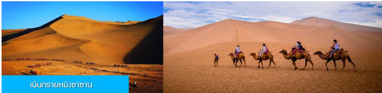
เนินทรายหมิงซาซาน

พักที่ REZEN HOTEL ระดับ 4 ดาวห้องดีนหรือเทียบเท่าในเมือง เจียยวี่กวน