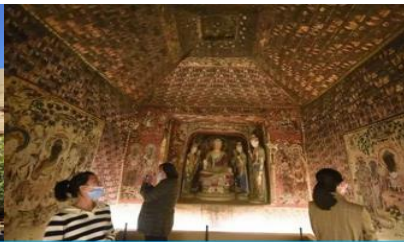
ชมภาพยนตร์ 3 มิติ