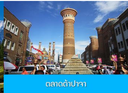
ตลาดต้าปาจา