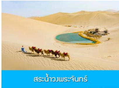
สระน้ำวงพระจันทร์