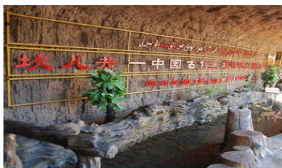
ระบบชลประทานอุ๋นหลู่ฟาน

พักที่ HAMPTON BY HILTON HOTEL โรงแรมระดับ 4 ดาวหรือเทียบเท่าในเมืองอุ๋นหลู่ฟาน