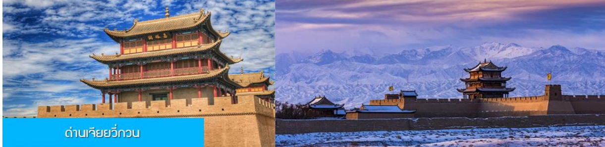
ด่านเจียยวี่กวน