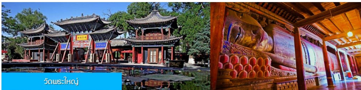
วัดพระใหญ่

พักที่ SI LU QIAN XI HOTEL โรงแรมระดับ 4 ดาวท้องถิ่น หรือเทียบเท่าในเมืองจางเยี่ย