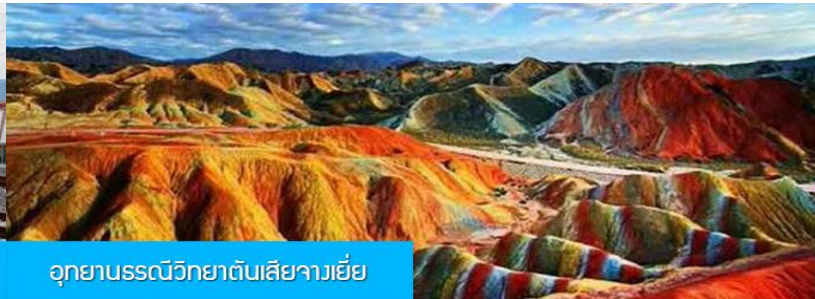
อุทยานธรณีวิทยาต้นเสีจางเยี่ย