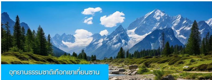
อุทยานธรรมชาติเทือกเขาเทียนชาน

พักที่ HAMPTON BY HILTON URUMQI HOTEL โรงแรมระดับ 4 ดาวหรือเทียบเท่าในเมืองอูรูมูฉี