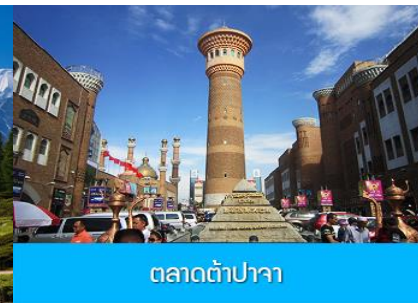
ตลาดต้าปาจา

วันที่เจ็ด เมืองอูรูมูฉี – ภูเขาเทียนชาน -ตลาดต้าปาจา