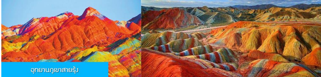
อุทยานภูเขาสายรุ้ง