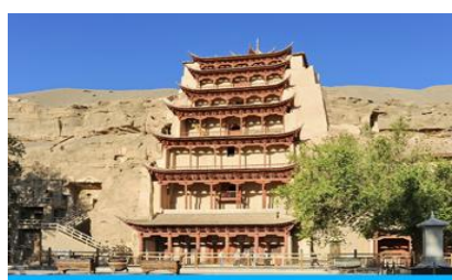
ถ้ำหินมั่วเกา

ค่ำ รับประทานอาหารค่ำ ณ ภัตตาคาร พักที่ METRO PARK HOTEL โรงแรมระดับ 4 ดาวหรือเทียบเท่าในเมืองตุนหวง