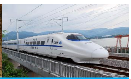
นั่งรถไฟความเร็วสูง

วันที่ห้า เมืองตุนหวง – ถ้ำหินมั่วเกา- ชมภาพยนตร์ 3 มิติ -รถไฟความเร็วสูงสู่เมืองอู่หลู่ฟาน