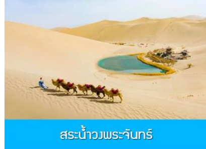
สระน้ำวงพระจันทร์