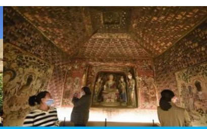
ชมภาพยนตร์ 3 มิติ