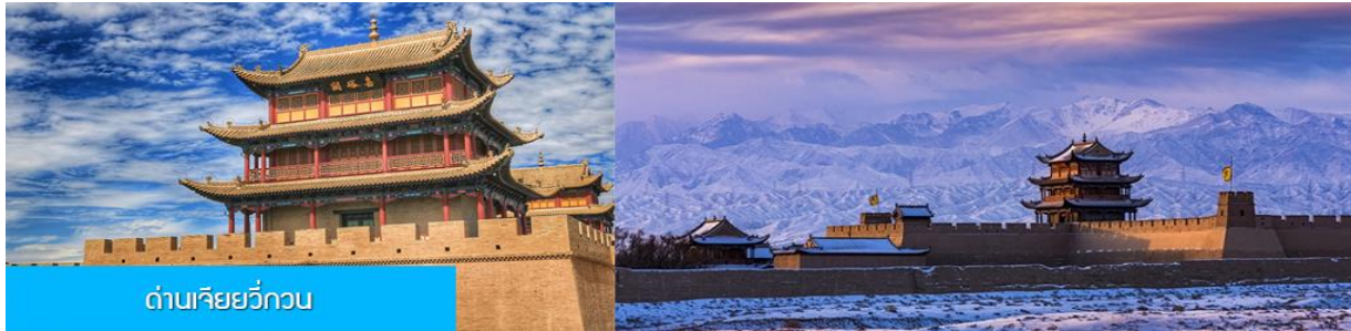
ด่านเจียยวี่กวน