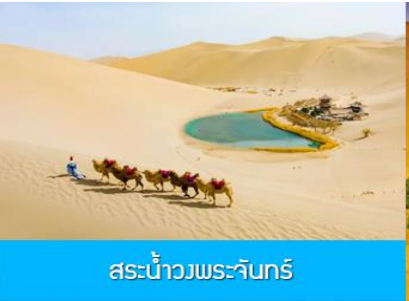
สระน้ำวงพระจันทร์