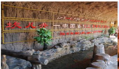
ระบบชลประทานกู๋หลู่ฟาน

พักที่ HAMPTON BY HILTON HOTEL โรงแรมระดับ 4 ดาวหรือเทียบเท่าในเมืองกู๋หลู่ฟาน