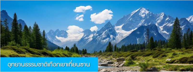
อุทยานธรรมชาติเทือกเขาเทียนชาน

พักที่ HAMPTON BY HILTON URUMQI HOTEL โรงแรมระดับ 4 ดาวหรือเทียบเท่าในเมืองอูรูมูฉี