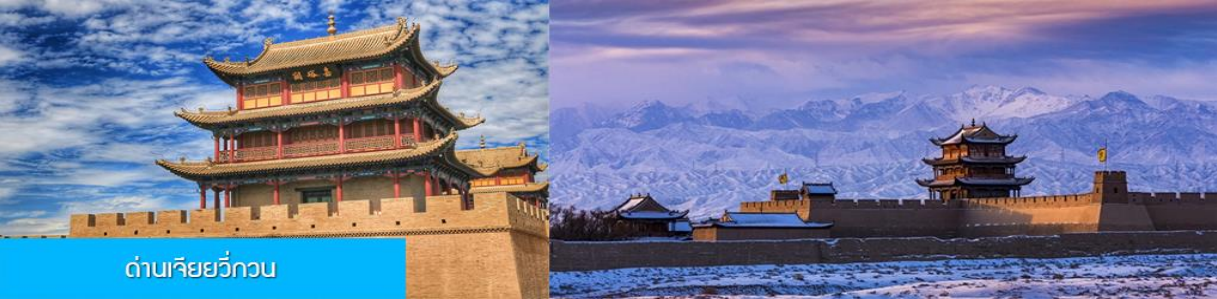
ด่านเจียยวี่กวน