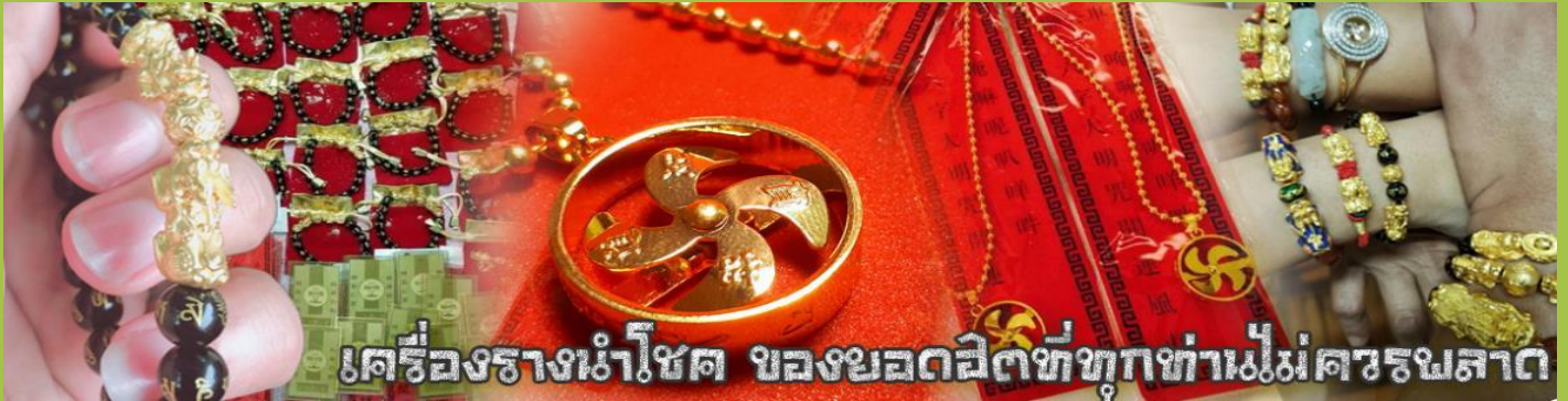
เครื่องรางนำโชค ของยอดฮิตที่ทุกท่าไม่ควรมขาด

ว่าจะเป็น “เทียนลก (กวางสวรรค)” เป็นชื่อเดิม ส่วนจีนกวางตุงจะเรียกว่่า “เผ่ย้า” และคนจีนแต้จิ๋วจะเรียกว่่า “ผีชีว”และ ยังมี จำหน่ายยาสมุนไพรบำรุงเพิ่มข้แรงตามความเชื่อของคนฮ่องกง