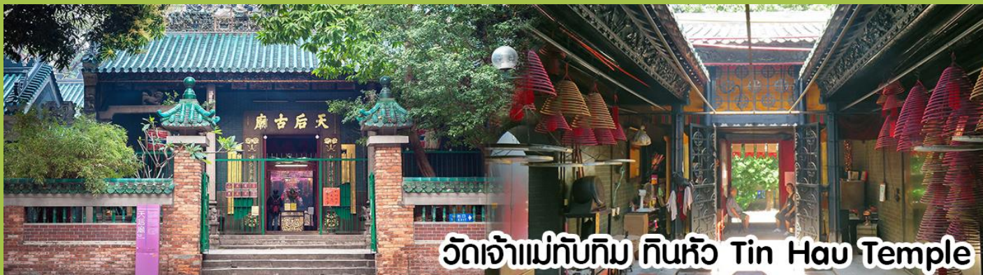
วัดเจ้าแม่ทับทิม ทินหัว Tin Hau Temple

นำทุกท่าน ไหว้ศาลเจ้าแม่ทับทิม ทินหัว (Tin Hau Temple) เป็นวัดเก่าแก่และสำคัญอีกวัดหนึ่งของฮ่องกง เพราะในสมัยก่อน ฮ่องกงเป็นเพียงหมู่บ้านชาวประมง ซึ่งเคารพนักถือเจ้าแม่ทับทิมว่าเป็นเทพแห่งท้องทะเล เพื่อให้เดินทางปลอดภัย เวลาออกไป ทำงานไกลๆ หรือออกหาปลา นอกจากการมาสักการบูชาเจ้าแม่ทับทิมในเรื่องของการเดินทางให้ปลอดภัยแล้ว ไอลัที่สำคัญอีกอย่างหนึ่งของวัดเจ้าแม่ทับทิม ทินหัว (Tin Hau Temple) จะเป็นขดรูปสีแดงขนาดใหญ่ ที่แขวนอยู่ตามเพดานด้านใน ของวัดก็จะเป็นสถาปัตยกรรมแบบวัดจีน สร้างขึ้นตั้งแต่ปี ค.ศ. 1876 โดยทางเข้าของวัดจะอยู่ติดกับสวนสาธารณะเล็ก ๆ ที่มี ต้นไม้ใหญ่หลายต้น ให้บรรยากาศร่มรื่น