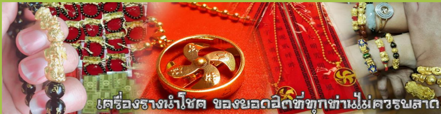
เครื่องรางนำโชค ของยอดฮิตที่ทุกท่านไม่ควรพลาด

จากนั้นนำท่านสู่ ร้านหยก ชมความงามปีเซียะ ที่เชื่อกันว่าเป็นวัดกุ่มงดลยอดนิคม ที่มีการนำมาบูชา เพื่อให้ช่วยป้องกันสิ่งชั่วร้าย เรียกทรัพย์สินเงินทองให้ไหลมาเทมา และกักเก็บทรัพย์นั้นไม่ให้รั่วไหลออกไปไหนได้ ชาวจีนโบราณเชื่อกันว่า ปีเซียะเป็นสัตว์ประหลาดที่รวมลักษณะของสัตว์มงคลทั้ง 5 ชนิดไว้ด้วยกัน ได้แก่ มังกร พญาราชสีห์หรือสิงโต, อินทรี, กวาง, และแมว โดยตามตำนานเล่าว่า ปีเซียะเป็นลูกมังกรตัวที่ 9 (เทพแห่งโชคลาภ) ของพญามังกรสวรรค์ มีชื่อเรียกด้วยกันหลายชื่อไม่ว่าจะเป็น “เทียนลก (กวางสวรรค์)” เป็นชื่อเดิม ส่วนจีนกวางตุ้งจะเรียกว่า “เผ่ย่า” และคนจีนแต้จิ๋วจะเรียกว่า “ผีชีว” และ ยังมีจำหน่ายยาสมุนไพรบำรุงเพิ่มพูนความแข็งแรงตามความเชื่อของคนฮ่องกง