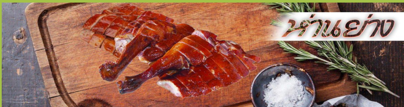
ห่านย่าง

เที่ยง รับประทานอาหาร ณ กั๊ดตาตาร ****เมนูท่านอย่างต้นตำหรับฮ่องกงแสนอร่อย****