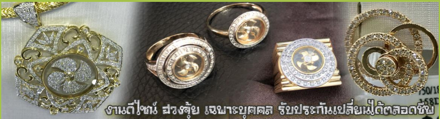
งานตีโขน สว่างคู่ขวัญ เฉพาะบุคคล รับประกันเปลี่ยนเมื่อตัดลอดชีพ

นำท่านเยี่ยมชม โรงงานจิวเวลรี่ ที่ขึ้นชื่อของฮ่องกงพบกับงานดีไซน์ที่ได้รับรางวัลอันดับยอดเยี่ยม และใช้ในการเสริมดวงเรื่อง ฮวงจุ้ยนำความโชคดี มั่งมั่งแก่ผู้สวมใส่ ซึ่งในเมืองไทยก็ได้นิยมแพร่หลายออกไป ไม่ว่าจะเป็นกลุ่ม ดารา นักการเมือง พ่อค้าแม่ขายที่ประกอบธุรกิจ เจ้าของกิจการห้างร้านต่าง ๆ ซึ่งเชื่อกันว่าจะนำสิ่งดี ๆ ปัดเป่าสิ่งชั่วร้ายให้กับบุคคลที่สวมใส่ ซึ่งจะมีมากมายหลายชนิด เช่น จี้กั้งหัน แหวนรุ่นต่าง ๆ นาฬิกาข้อมือ (ซึ่งผู้สวมใส่จะได้รับการดูลายมือจากซินเซประจำร้าน เพื่อนำวิธีการเสริมดวงในการสวมใส่โดยไม่ติดค่าบริการ)