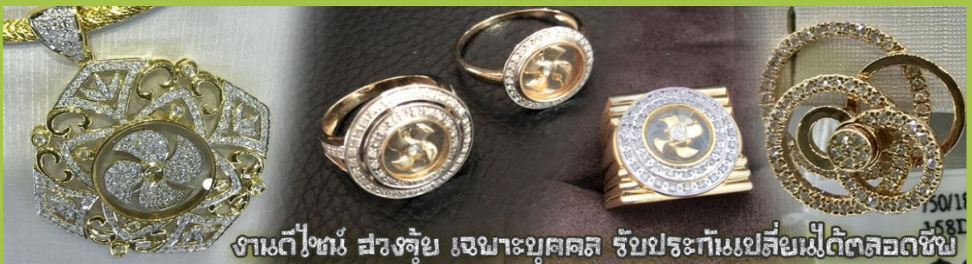
งานดีไซ์ สวองตุ้ย เฉพาะบุคคล รับประกันเปลี่ยนเม็ดตลอดชีพ

นำท่านเยี่ยมชม โรงงานจิวเวลรี่ ที่ขึ้นชื่อของฮ่องกงพบกับงานดีไซน์ที่ได้รับรางวัลอันดับยอดเยี่ยม และใช้ในการเสริมดวงเรื่อง ฮวงจุ้ยนำความโชคดี มั่งมั่งแก่ผู้สวมใส่ ซึ่งในเมืองไทยก็ได้นิยมแพร่หลายออกไป ไม่กว่าจะเป็นกลุ่ม ดารา นักการเมือง พ่อค้าแม่ขายที่ประกอบธุรกิจ เจ้าของกิจการห้างร้านต่าง ๆ ซึ่งเชื่อกันว่าจะนำสิ่งดี ๆ ปิดเป่าสิ่งชั่วร้ายให้กับบุคคลที่สวมใส่ ซึ่งจะมีมากมายหลายชนิด เช่นจี้กั้งหัน แหวนรุ่งต่าง ๆ นาฬิกาข้อมือ (ซึ่งผู้สวมใส่จะได้รับการดูอายุจากซินเซประจำร้าน เพื่อแนะนำวิธีการเสริมดวงในการสวมใส่โดยไม่ติดต่อบริการ)