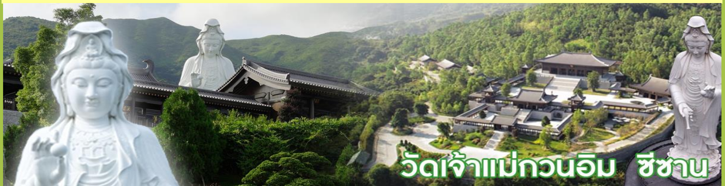
วัดเจ้าแม่กวนอิม ชีซาน

วัดชีซาน หลายคนที่เคยไปเที่ยวฮ่องกงมาแล้ว อาจจะยังไม่เคยเยือนวัดชีซาน หรือ Tsz Shan Monastery เป็นวัดที่มีเจ้าแม่กวนอิมองค์ใหญ่เป็นอันดับสองของโลก มีความสูงถึง 76 เมตร ตั้งอยู่บนเนื้อที่กว่า 29 ไร่ ในเกาะฮ่องกง โดยมีนาย ลีกาซิง มหาเศรษฐีชื่อดังของฮ่องกง บริจาคเงินสร้างวัดถึง 193 ล้านดอลลาร์เลยทีเดียว