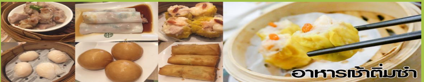
อาหารเช้าต้มซ่า

เช้า รับประทานอาหารเช้า (ต้มซ่า) ณ กัดตาดาร