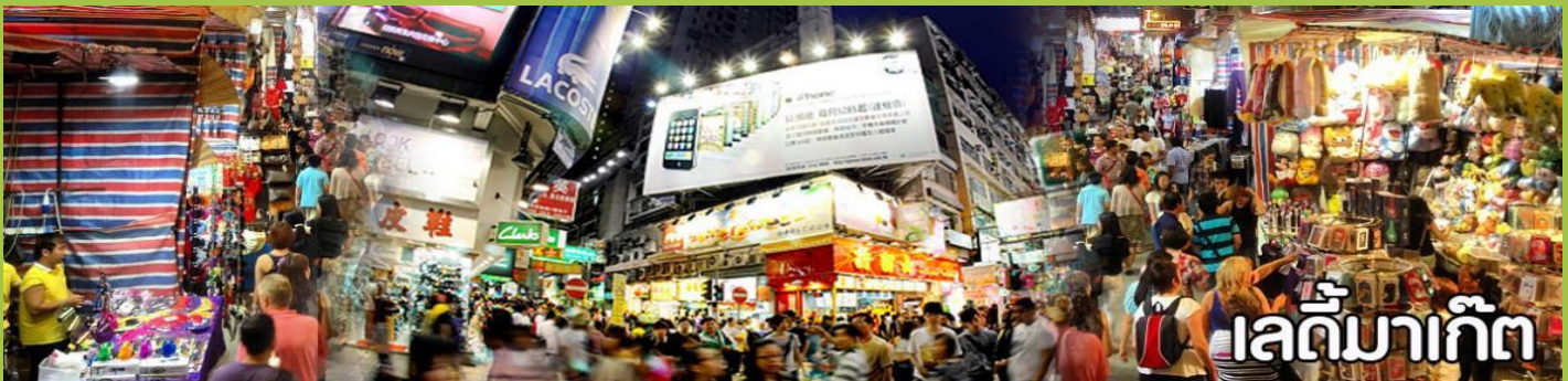
เลดี้มาร์เก็ต

จากนั้นอิสระให้ท่านช้อปปิ้ง ตลาดเลดี้ มาร์เก็ต (Ladies Market) เป็นตลาดบนถนนคนเดินสไตล์ Night Market แบบบ้านเรา ไม่ได้มีขายเฉพาะแต่ของผู้หญิงแต่มีของขายทุกอย่างอย่าง เหมือนพวกตลาด Night ของบ้านเรา โดยจะปิดถนน Tong Choi Street ตั้งแต่แยกที่ตัดกับถนน Argyle Street ยาวตลอดถนน Tong Choi Street ไปจนถึงถนน Dundas Street ยาวประมาณ 500 เมตร สินค้าที่ขายกันจะมีอยู่หลากหลายแบบเช่นพวกตุ๊กตาการ์ตูนต่าง ๆ จากดิสนีย์, Marvel และจากญี่ปุ่น ประเภทสินค้า เสื้อผ้า นาฬิกากระเป๋า ตุ๊กตา ของฝาก ของที่ระลึก ต่าง ๆ ใครต้องการจะซื้อของที่ระลึกหรือของฝากต่าง ๆ ของฮ่องกงก็สามารถมาเดินเลือกซื้อกันได้ที่นี่