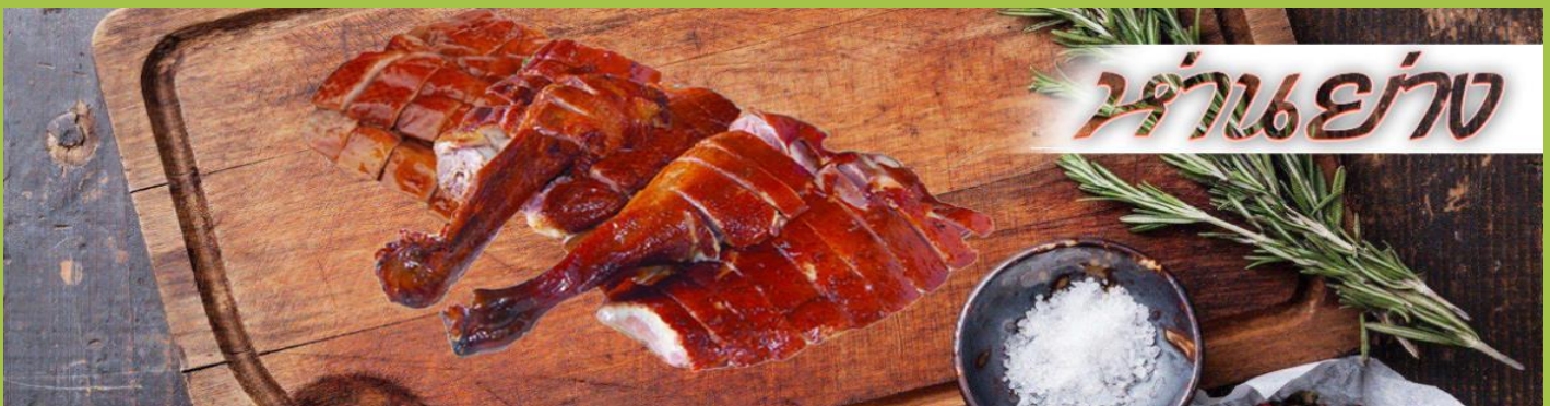
ห่านย่าง

เที่ยง รับประทานอาหาร ณ กัดดาการ *****เมนูท่านอย่างต้นตำหรับฮ่องกงแสนอร่อย*****