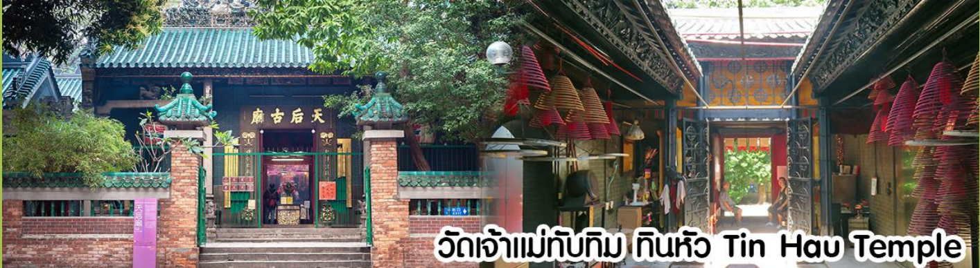
วัดเจ้าแม่ทับทิม ทินหั่ว Tin Hau Temple

นำทุกท่าน ไหว้ศาลเจ้าแม่ทับทิม ทินหั่ว (Tin Hau Temple) เป็นวัดเก่าแก่และสำคัญอีกวัดหนึ่งของฮ่องกง เพราะในสมัยก่อน ฮ่องกงเป็นเพียงหมู่บ้านชาวประมง ซึ่งเคารพนักถือเจ้าแม่ทับทิมว่าเป็นเทพีแห่งท้องทะเล เพื่อให้เดินทางปลอดภัย เวลาออกไป ทำงานไกลๆ หรือออกหาปลา นอกจากการมาสักการบูชาเจ้าแม่ทับทิมในเรื่องของการเดินทางให้ปลอดภัยแล้ว ไอลัที่สำคัญอีกอย่างหนึ่งของวัดเจ้าแม่ทับทิม ทินหั่ว (Tin Hau Temple) จะเป็นชุดรูปสีแดงขนาดใหญ่ ที่แขวนอยู่ตามเพดานด้านใน ของวัดก็จะเป็นสถาปัตยกรรมแบบวัดจีน สร้างขึ้นตั้งแต่ปี ค.ศ. 1876 โดยทางเข้าของวัดจะอยู่ติดกับสวนสาธารณะเล็ก ๆ ที่มี ต้นไม้ใหญ่หลายต้น ให้บรรยากาศร่มรื่น