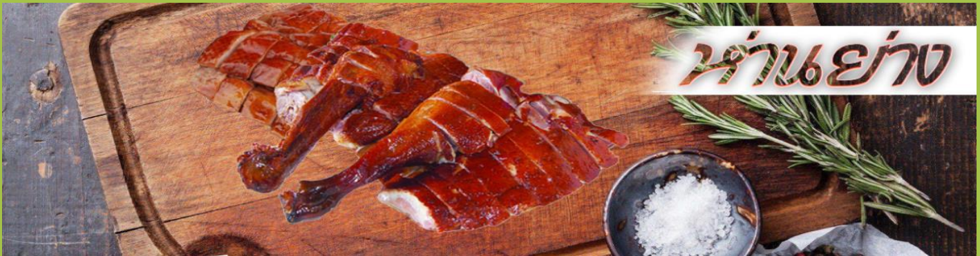
ห่านย่าง

เที่ยง รับประทานอาหาร ณ ภัตตาคาร *****เมฆุ่่านอย่างตันตำหรับฮ่องกงแสนอร่อย*****