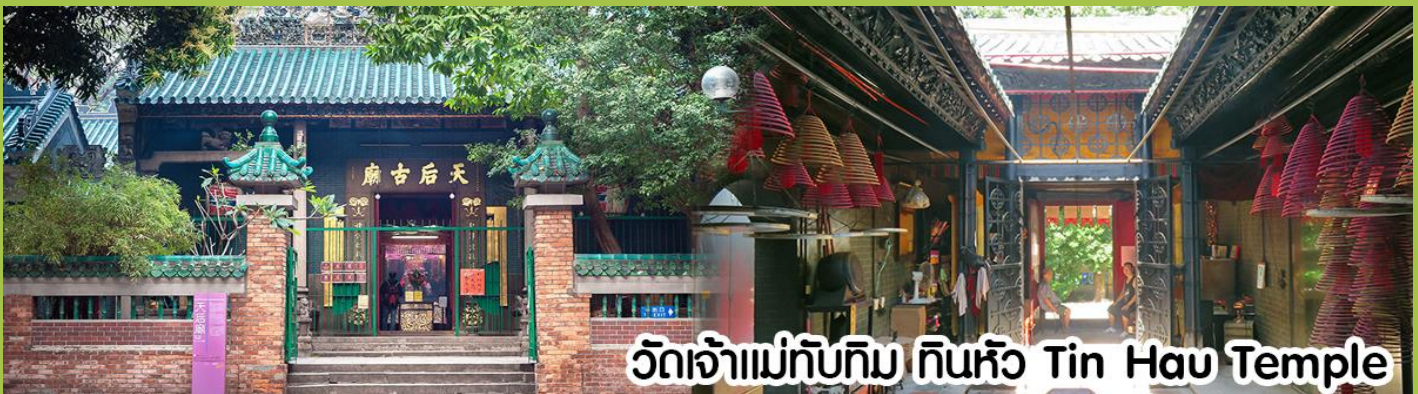
วัดเจ้าแม่ทับทิม ทินหัว Tin Hau Temple

นำทุกท่าน ไหว้ศาลเจ้าแม่ทับทิม ทินหัว (Tin Hau Temple) เป็นวัดเก่าแก่และสำคัญอีกวัดหนึ่งของฮ่องกง เพราะในสมัยก่อนฮ่องกงเป็นเพียงหมู่บ้านชาวประมง ซึ่งเคารพนักถือเจ้าแม่ทับทิมว่าเป็นเทพีแห่งท้องทะเล เพื่อให้เดินทางปลอดภัย เวลาออกไปทำงานไกลๆ หรือออกหาปลา นอกจากการมาสักการบูชาเจ้าแม่ทับทิมในเรื่องของการเดินทางให้ปลอดภัยแล้ว ไหว้ที่สำคัญอีกอย่างหนึ่งของวัดเจ้าแม่ทับทิม ทินหัว (Tin Hau Temple) จะเป็นชุดรูปสีแดงขนาดใหญ่ ที่แขวนอยู่ตามเพดานด้านในของวัดก็จะเป็นสถาปัตยกรรมแบบวัดจีน สร้างขึ้นตั้งแต่ปี ค.ศ. 1876 โดยทางเข้าของวัดจะอยู่ติดกับสวนสาธารณะเล็ก ๆ ที่มีต้นไม้ใหญ่หลายต้น ให้บรรยากาศร่มรื่น