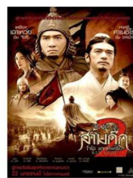
ภาพยนตร์และซีรีส์ชื่อดัง ถ่ายทำที่ Hengdian World Studios