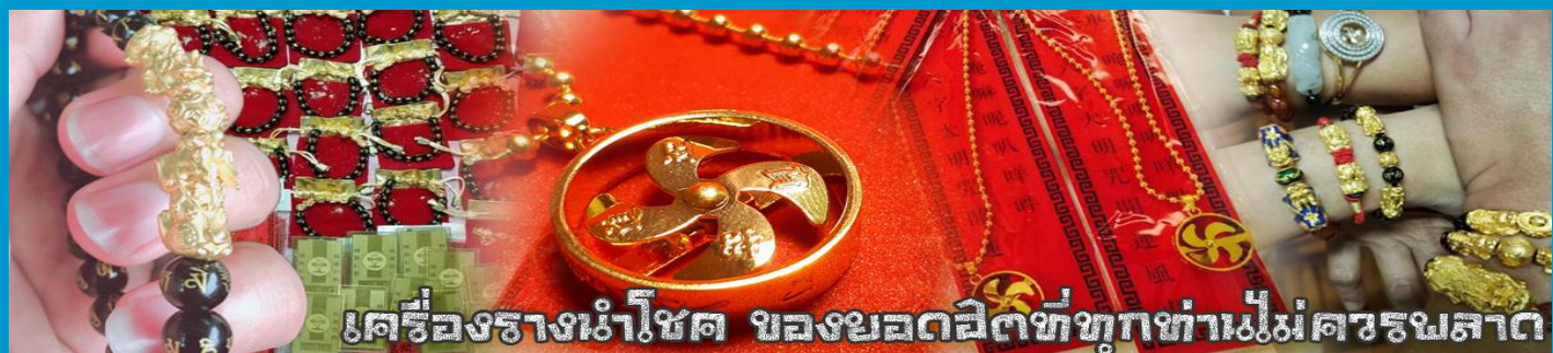
เครื่องรางเข้าโชด ของขอลดสิ่งชั่วร้ายทำไม่เศรษฐศาสตร์

ชั่วร้าย เรียกทรัพย์สินเงินทองให้ไหลมาเทมา และกักเก็บทรัพย์นั้นไม่ให้รั่วไหลออกไปไหนได้ ชาวจีนโบราณเชื่อกันว่า ปีเซียะเป็นสัตว์ประหลาดที่รวมลักษณะของสัตว์มงคลทั้ง 5 ชนิดไว้ด้วยกัน ได้แก่ มังกร พญาราชสีห์หรือสิงโต,อินทรี,กวาง,และแมว โดยตามตำนานเล่าว่า ปีเซียะเป็นลูกมังกรตัวที่ 9 (เทพแห่งโชคลาภ) ของพญามังกรสวรรค์ มีชื่อเรียกด้วยกันหลายชื่อไม่ว่าจะเป็น “เกียนลก (กวางสวรรค์)” เป็นชื่อเดิม ส่วนจีนกวางตุ้งจะเรียกว่า “เผ่เย้า” และคนจีนแต้จิ๋วจะเรียกว่า “ผีชีว”