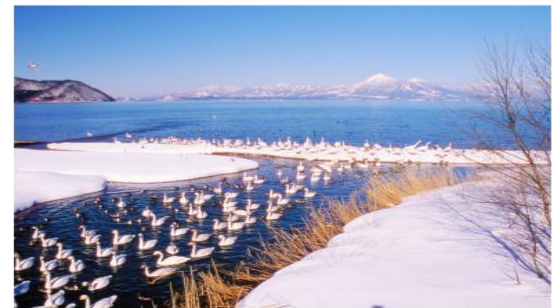
ทะเลสาบอินาวะชิโร Inawashiro-ko