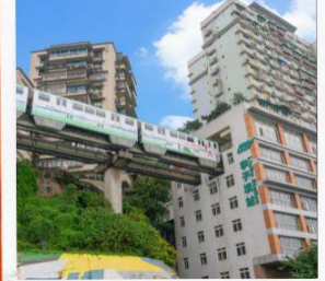
นั่งรถไฟทะลุตึก