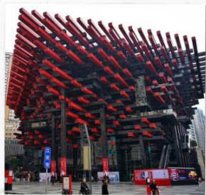
พิพิธภัณฑ์ศิลปะฉงชิ่ง