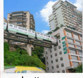
นั่งรถไฟทะลุตึก