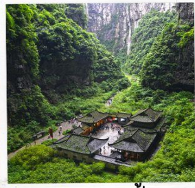
อุทยานหลุมฟ้า สะพานสวรรค์