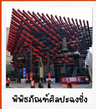
พิพิธภัณฑ์ศิลปะฉงชิ่ง