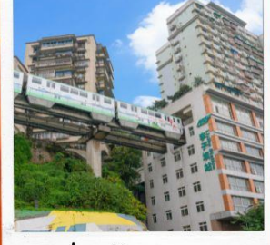
นั่งรถไฟทะลุตึก