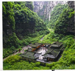
อุทยานหลุมฟ้า สะพานสวรรค์