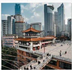
ตึกหุยซิง (ตึก 22ชั้น)