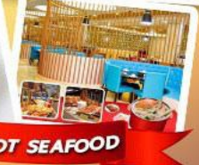
ก๊วยแม่น้ำ + HOTPOT SEAFOOD