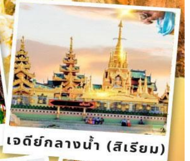
เจดีย์กลางน้ำ (สิริเยม)