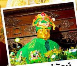
ขอพรแม่ยักย์