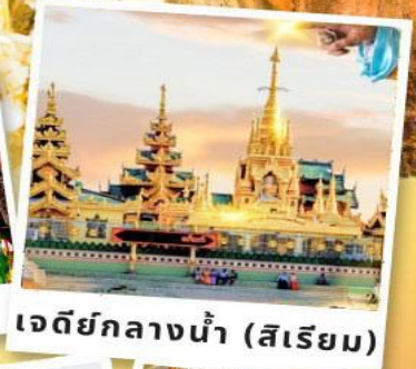
เจดีย์กลางน้ำ (สิเรียม)