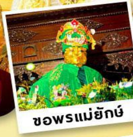
ซอพรแม่ยักย์