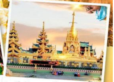
เจดีย์กลางน้ำ (สิเรียม)