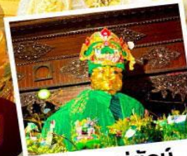
ขอพรแม่ยักย์