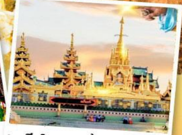
เจดีย์กลางน้ำ (สิเรียม)