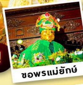
ซอพรแม่ยักยี