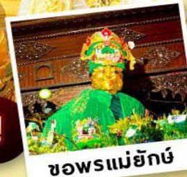
ขอพรแม่ยักย์