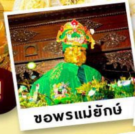
ขอพรแม่ยักย์