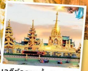
เจดีย์กลางน้ำ (สิริเยม)