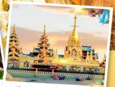
เจดีย์กลางน้ำ (สิริเรียม)