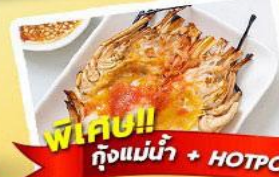
พิเศษ!! ก๊วยแม่น้ำ + HOTPOT SEAFOOD