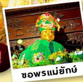
ขอพรแม่ยักย์