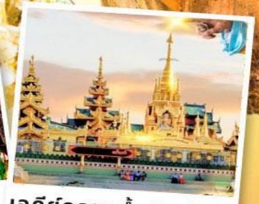
เจดีย์กลางน้ำ (สิริเรียม)