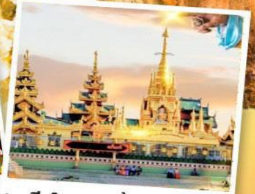
เจดีย์กลางน้ำ (สิเรียม)