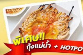
พิเศษ!! ก๊วยแม่น้ำ + HOTPOT SEAFOOD