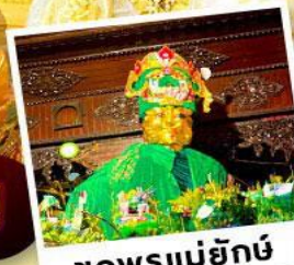
ขอพรแม่ยักย์