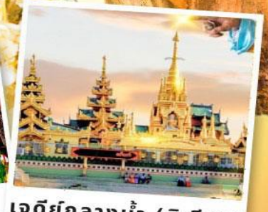
เจดีย์กลางน้ำ (สิริเยม)