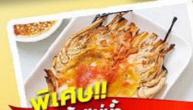
พิเศษ!! ก๊วยแม่น้ำ + HOTPOT SEAFOOD