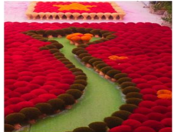
หมู่บ้านผลิตรูป Quang Phu Cau Village