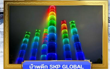
น้ำพุตึก SKP GLOBAL