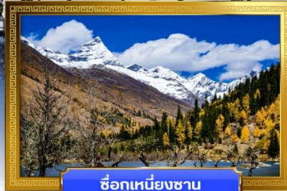
ชื่อภูเขาหิมะชาน