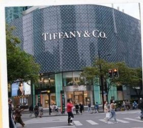
ถนนหวยไ่