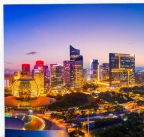
วิวแม่ฟ้าเขียวถึง