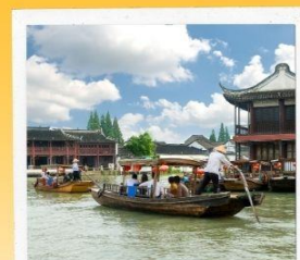
เมืองโบราณจูเจียเจี้ยว