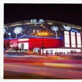
ห้าง INN 77