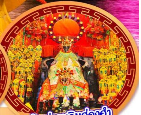
เจ้าแม่กวนอิมฮ่องฮำ

นมัสการเจ้าแม่กวนอิมฮ่องฮำ หมูนกัหันรับโชคลาภเงินทองที่วัดแซงกหวีว ขอพรความรักกับผู้เต่าจันตรา วัดหวังต้าเซียน