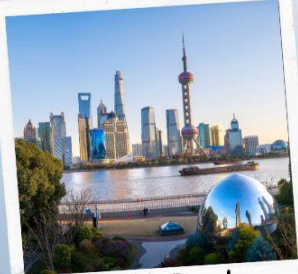
North Bund Greenland