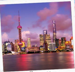
ชมวิวยามค่ำคืน