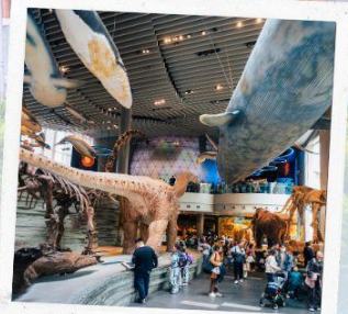
Shanghai Natural history Museum