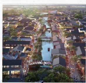
เมืองโบราณ ผานหลงกู่เจิน