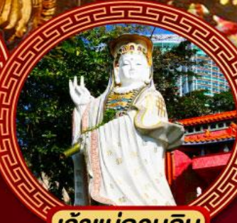
เจ้าแม่กวนอิม ริพัลส์เบย์