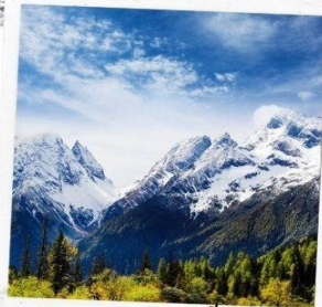
ภูเขาหิมะการ์เซีย ต้ากู่ปิงชวณ