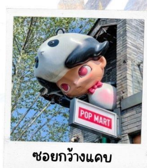
ชอยกวางแดบ