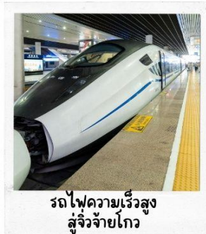
รถไฟความเร็วสูง สู่จิวจ้ายโกว