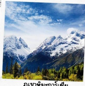
ภูเขาหิมะการ์เซีย ตำกู่ปิงชวน