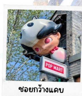
ชอยกวางแดบ