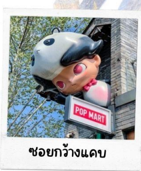
ชอยกวางแดบ