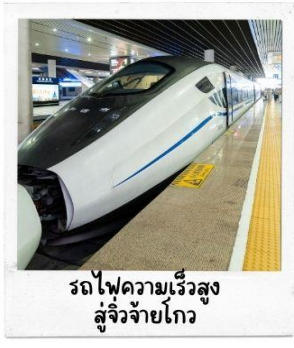
รถไฟความเร็วสูง สู่จิวจ้ายโกว