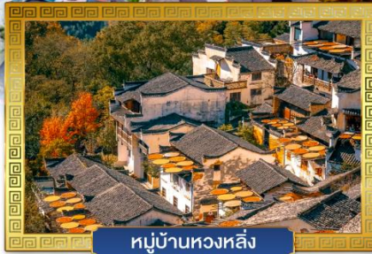
หมู่บ้านหวงหลิ่ง