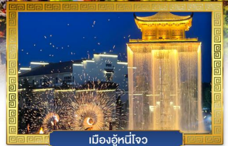
เมืองอู่หนี่โจว