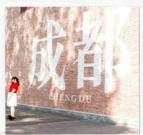
CHENGDU EASTERN MEMORY