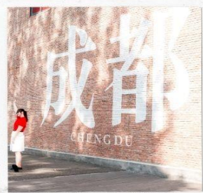
CHENGDU EASTERN MEMORY