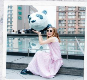
IFS แพนด้าปิงตึก