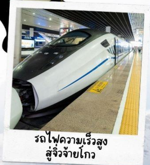
รถไฟความเร็วสูง สู่จี้จ้ายโกว