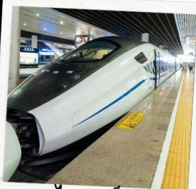
รถไฟความเร็วสูง สู่จี้จ้ายโกว