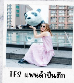
IFS แพนด้าปีนตึก