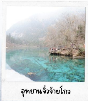
อุทยานจี้จ้ายโกว