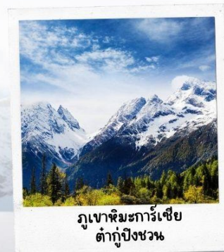
ภูเขาหิมะการ์เซีย ต่ากู่ปิงชว่น