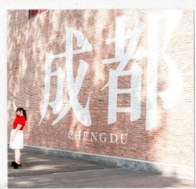
CHENGDU EASTERN MEMORY