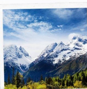
ภูเขาหิมะการ์เซีย ต้ากู่ปิงชว่น