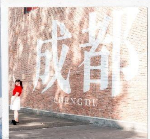
CHENGDU EASTERN MEMORY