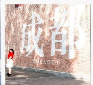
CHENGDU EASTERN MEMORY