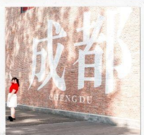
CHENGDU EASTERN MEMORY