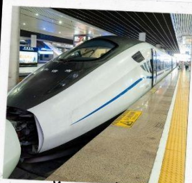
รถไฟความเร็วสูง สู่จี้จ้ายโกว