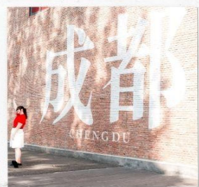
CHENGDU EASTERN MEMORY