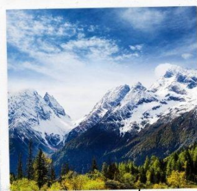
ภูเขาหิมะการ์เซีย ต้ากู่ปิงชว่น