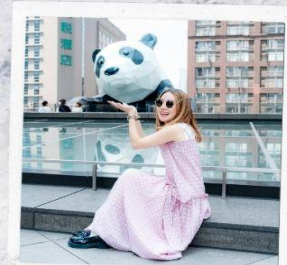
IFS แพนด้าปิงตึก