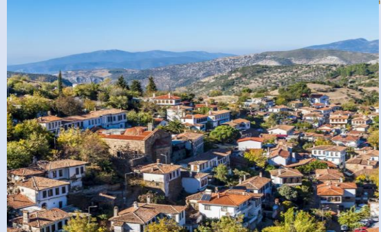
ทิวทัศน์ของหมู่บ้านจากหอคอย โฮดริ เมย์แดน (Hodri Meydan)

นำท่านเดินทางสู่ หมู่บ้านซีรินเซ (Sirince Village) หมู่บ้านแห่งสองวัฒนธรรมระหว่างตุรเคียและกรีซ หมู่บ้านแห่งหุบเขาอุดมไปด้วยความสมบูรณ์บนยอดเขา สิ่งหนึ่งที่ทำให้หมู่บ้านซีรินเซโดดเด่นท่ามกลางสถานที่ท่องเที่ยวก็คือไวน์ เนื่องจากที่นี่คือหมู่บ้านชาวกรีกจริงๆ จึงมีวัฒนธรรมไวน์ รวมไปถึงไวน์ผลไม้อื่น อาทิ แอปเปิ้ล สตรอว์เบอร์รี่ กลัวย พีช เมล่อน ไวน์ผลไม้ของซีรินเซขึ้นชื่อมาก สามารถชิมไวน์และซ้อปิ้งในห้องใต้ดินในใจกลางหมู่บ้านซีรินเซ ตลาดนัดของหมู่บ้านมีจำหน่ายสบูโฮมเมด งานฝีมือผลิตภัณฑ์น้ำมันมะกอกทุกชนิด บ้านไวน์ และบ้านกรีกโบราณ นอกจากนี้ ทิวทัศน์ของหมู่บ้านจากหอคอย โฮดริ เมย์แดน (Hodri Meydan) ทางเหนือของหมู่บ้านซีรินเซก็สวยงามเช่นกัน