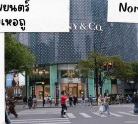
ถนนคนเดินหวยไห่