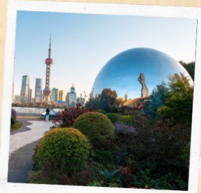
North bund green land