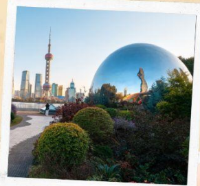
North bund green land