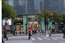
ถนนคนเดินหวยไห่