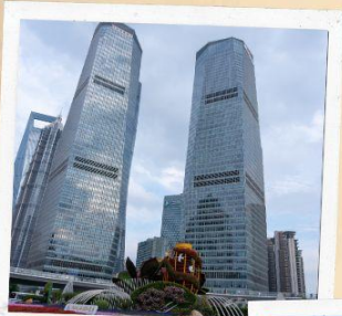
ย่านลู่เจียจู่ย