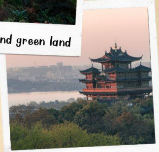
หอเจิ้งหวงเก๋อ