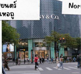
ถนนคนเดินหวยไห่