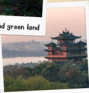
หอเจิ้งหวงเก๋อ