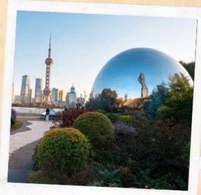
North bund green land