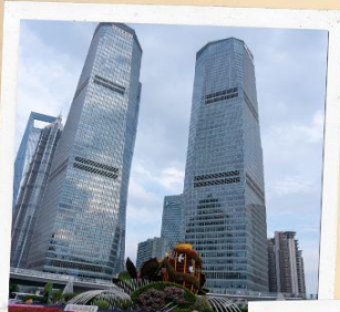
ย่านลู่เจียจู่ย