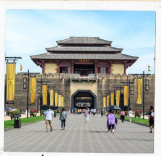
โรงถ่ายภาพยนตร์ ชิงหมิงช่างเหอฉู